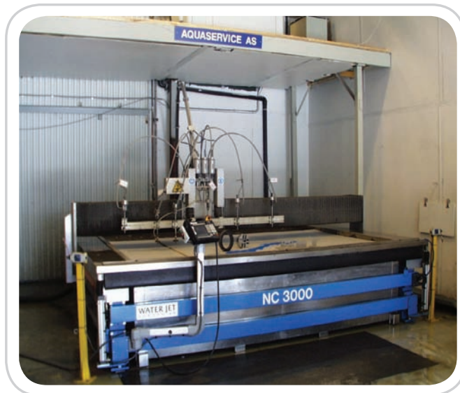
Maskinen har et bord på 3 x 2,5 meter

Kuttet er et kaldkutt, og dermed er delene uten materiell spenning. Det største kuttet vi har utført er figurskjæring i aluminium på 290mm tykkelse.